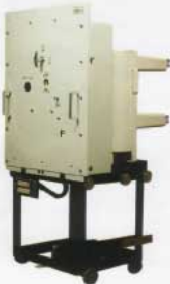
PVB 4 - 25 / 12 W

PVB 7 - 25 / 20 (W veya F) Delikli Vakumlu Kesici Anma Gerilimi 36 kV için 7 24 kV için 8 17.5 kV için 3 12 kV için 4 7.2 kV için 3 Kesici Tipi W Çekmeceli tip için F Sabit tip için Anma Akımı (A) (x 100) Kısa Devre Kesme Akımı (kA) (3 sn)