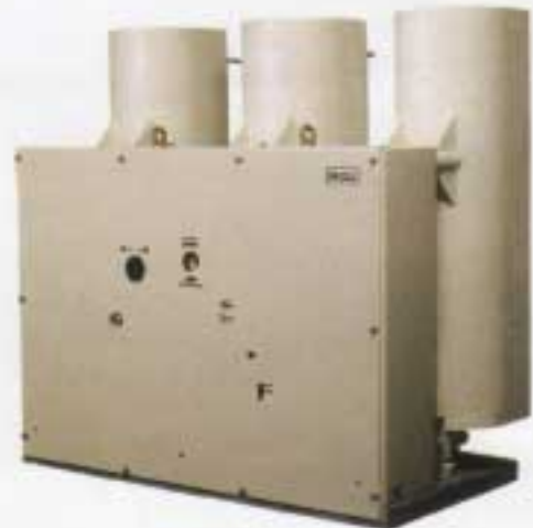
PVB 7 - 25 / 20 F